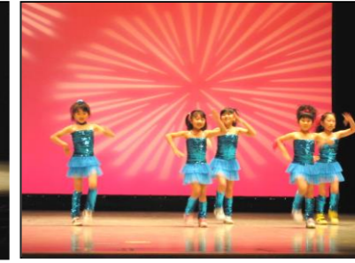
KIDS JAZZ DANCE教室